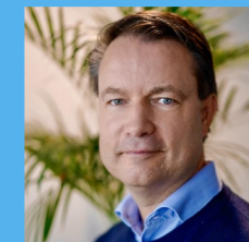
Fredrik Skåpe Cevt Business Models